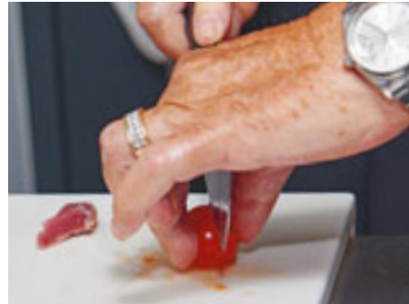
Im Alltag zieht die Köchin einfache Lebensmittel von guter Qualität der Haute Cuisine vor.