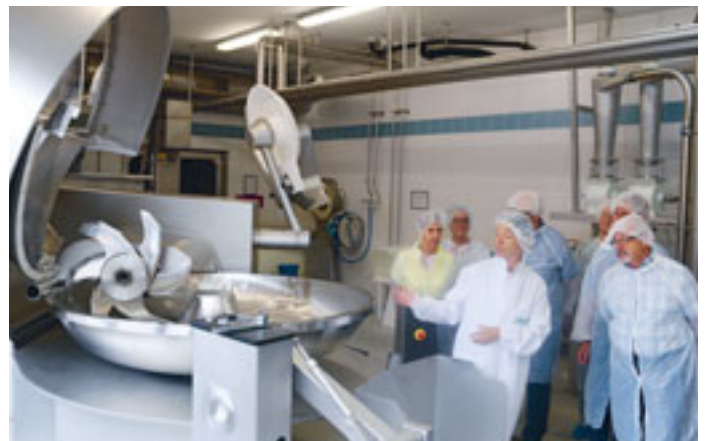
Rundgang durch die weltweit einzige Schabzigerfabrik beim Jahresausflug 2015: Der Kutter (links) zerkleinert nach der Vorgärung den Rohziger.