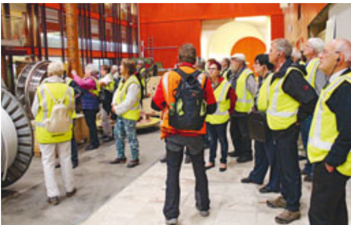
Beim Jahresausflug 2014 besuchte die Credit Suisse Pensioniertengruppe Aarau die Aareschlucht und das Grimselkraftwerk.