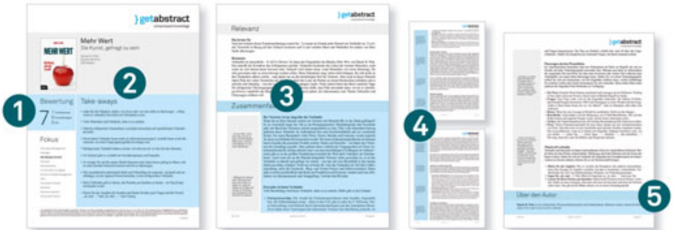
*Oben sehen Sie ein Beispiel einer Zusammenfassung aus der Compressed-Business-Bibliothek, Mehr Wert: Die Kunst gefragt zu sein, Daniel H. Pink, Ecowin, 2014

1 redaktionelle Bewertung, 2 die wichtigsten inhaltlichen Stichpunkte, 3 eine komplette Inhaltsangabe, 4 aussagekräftige Zitate und 5 eine Kurzbiografie der Autoren – alles lesbar in weniger als zehn Minuten.