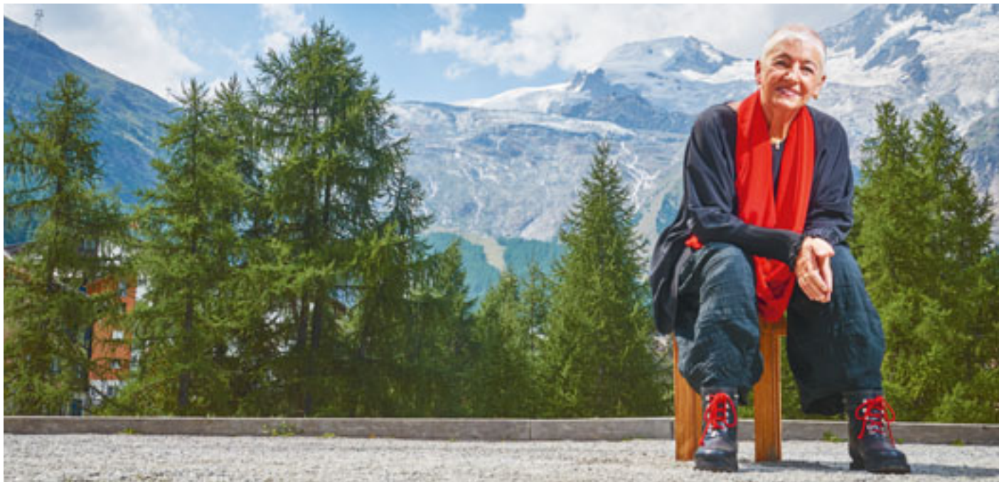
Die fast surreal schön anmutende Kulisse von Saas Fee mit Blick auf den Allalingsletscher. Nur wenige Meter entfernt befindet sich das Wohnhaus, welches das Ehepaar Dütsch vor zwölf Jahren für seine Pensionierung bauen liess.