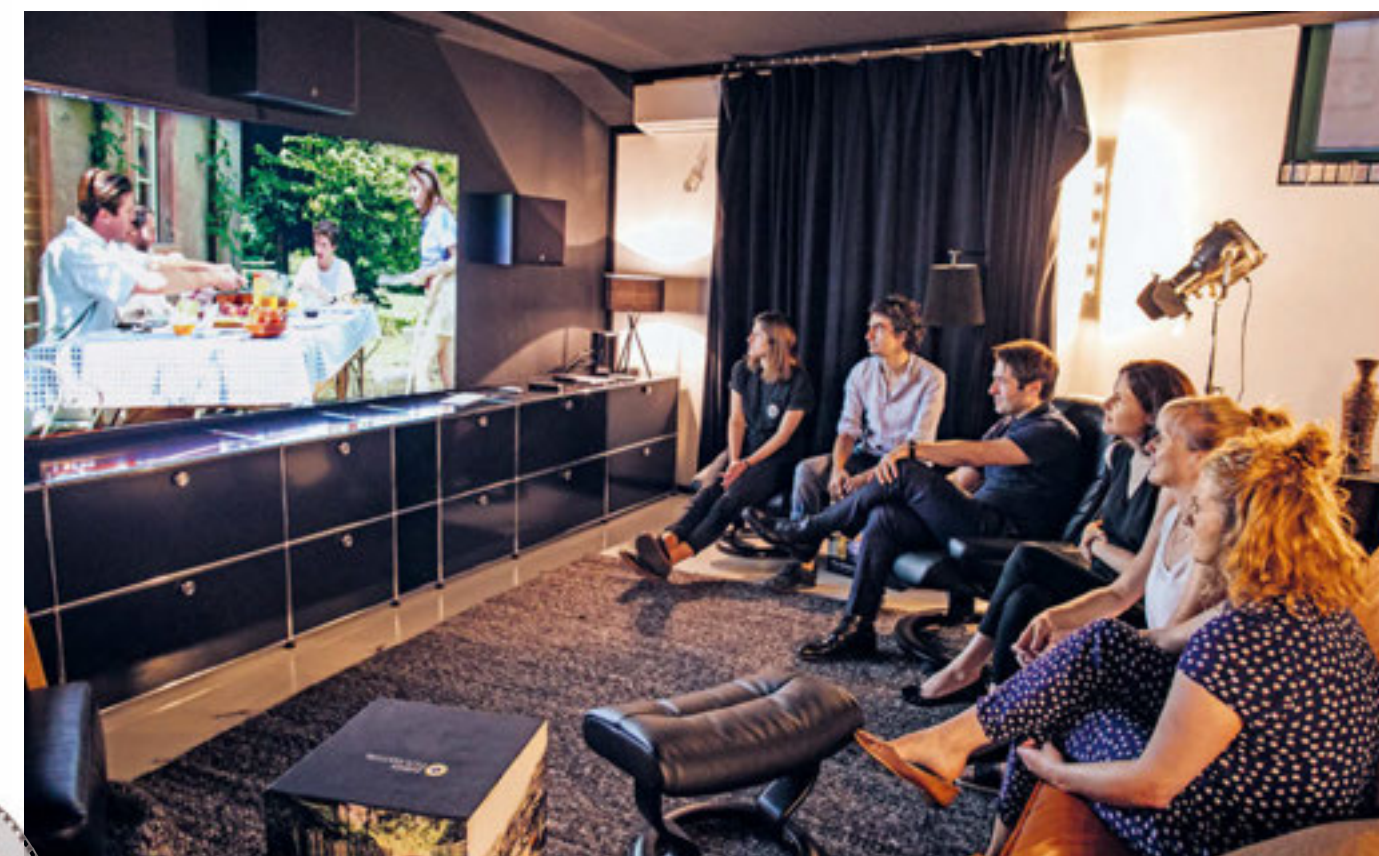
Das Programmerteam beim gemeinsamen Sichten eines Filmes.