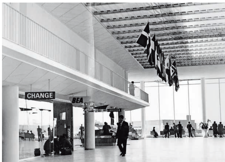
Links der Change-Schalter der SKA in der neu erbauten Abflughalle, 1953.