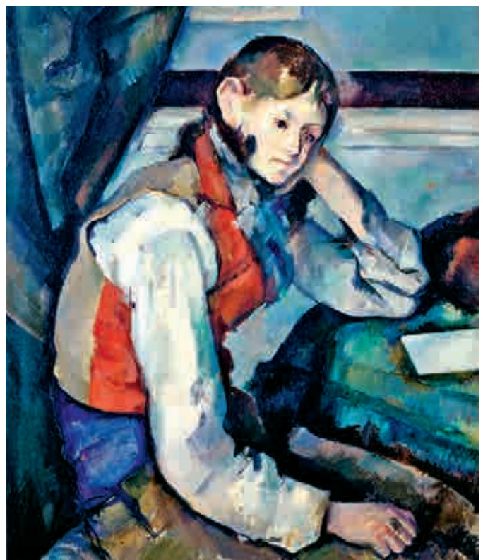
Der Knabe mit der roten Weste, um 1888/1890, Paul Cézanne (1839–1906), Stiftung E. G. Bührle, Zürich.