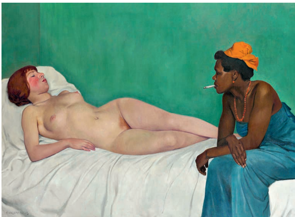
Félix-Edouard Vallotton: La Blanche et la Noire , 1913, Öl auf Leinwand, 114 × 147 cm, Kunstmuseum Bern, Eigentum: Hahnloser/ Jäggli Stiftung.