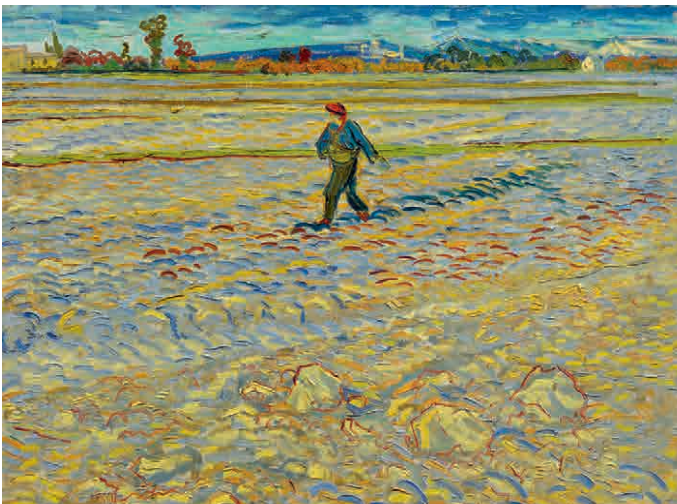
Vincent van Gogh: Le semeur , 1888, Öl auf Leinwand, 72 × 91,5 cm, Kunstmuseum Bern, Eigentum: Hahnloser/Jäggli Stiftung.